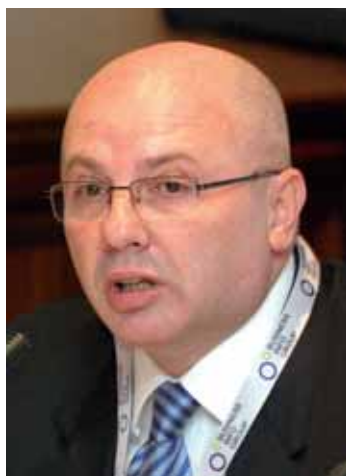
Slobodan Ilić, državni sekretar Ministarstva finansija

oporavak posle krize, a on će biti izuzetno spor, što znači da neće biti velikog povećanja radnih mesta. To znači da će penzionera biti sve više, a broj zaposlenih raste sporo. Postoji nedostatak poverenja zbog loših iskustava iz